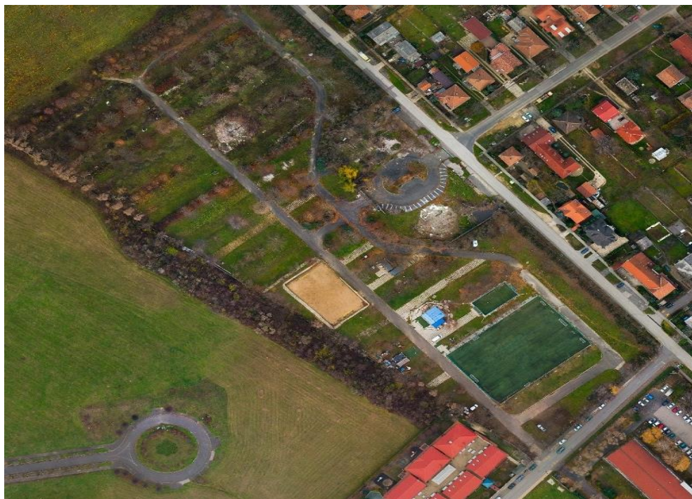
A kérdéses terület felülnézetből.

Az Óvoda u.- Kazinczy u. - Határ (gyalogút) u. által határolt terület több cikluson át, sőt több települési szabályozási tervben (pl. 2002, 2015. évi) is a mai sport és rekreációs célnak megfelelő övezetbe tartozott. Legutóbb 2017 őszén egy újabb tulajdonos mégis próbálkozott azzal, hogy itt lakóövezet létesítéséhez szerezzen támogatást. A testület ebben a kérdésben megosztott volt, de úgy határozott, hogy meg kell kérdezni az érintett (MÁV-telepi) lakosságot. A magánfejlesztő is aláírásgyűjtésbe fogott, de az szerintem megtévesztő volt, s nem mérvadó! Viszont a város által karácsony előtt tartott közvélemény-kutatáson érvényesen voksoló választópolgárok 80 %-a nem kívánta a lakóövezeti átminősítést! Azt kívánta, hogy a mai „különleges sport- és rekreációs övezeti besorolás” maradjon érvényben!