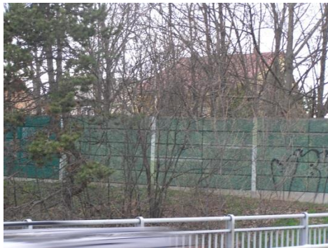
Milyen állapotban van?

Az ősz végén el szerettem volna kérni az önkormányzattól a 2016. végén Törökbálinton készített zajmérésekről szóló Vibrocomp tanulmányt. Hónapokon át nem jutottam hozzá. Az önkormányzatban nem találták, a Magyar Közút nem akarta kiadni (???), mivel ők személyesen átadták az önkormányzatnak; a mérést végző cég szerint a megrendelő (Magyar Közút) adhatja csak oda. Már közérdekű adatigénylést is adtam be az erre létrehozott hivatalban, de végül egy 2018. január 15-én érkezte-