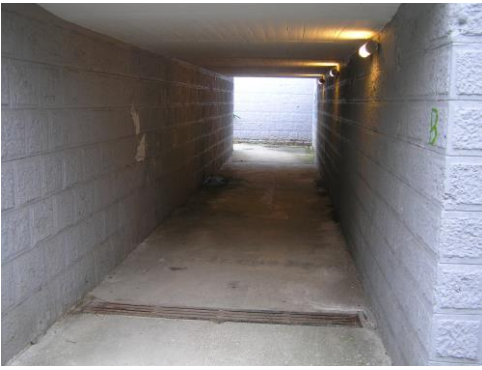
Alagút a sínek alatt.