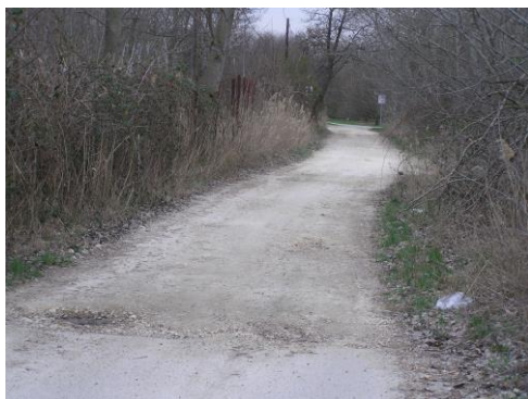
Csak ennyi hiányzik a Károlyi utcáig.