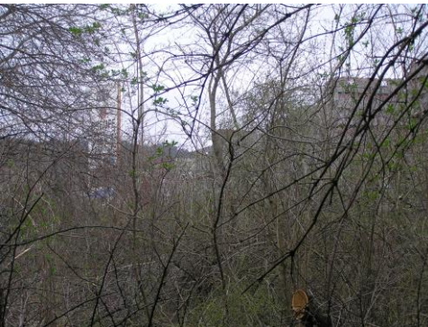
Csempe és építő anyagok a budaörsi oldalon.