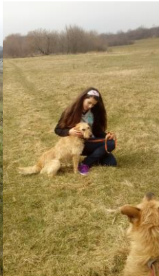
A kutyusok mellett van itt birkanyáj, vannak mangalicák és szürke marhák, sőt vágóhídről megmentett ugró ló is.

A menhelyen évente körülbelül 200-220 kutyának sikerül gazdát találni. Ez elég jó arány, és még csak nem is sejthetjük, mekkora ajándék az örökbe fogadott kutyusoknak szerető gazdihoz, családhoz kerülni.