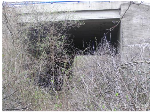
Budaörs felől az átjáró.