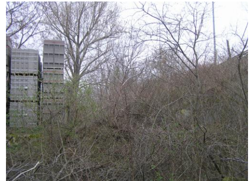
Erre kellene továbbvezetni a Törökugrató felé.