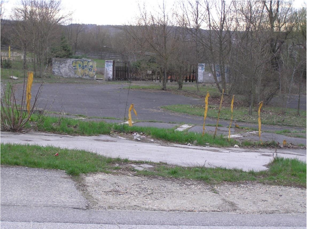
A volt kemping bejárata most.

Minden önkormányzat alapfeladata, hogy meghatározza távlati fejlesztési céljait, ahol bemutatja milyen községet, várost szeretne átadni gyermekei, unokái számára.