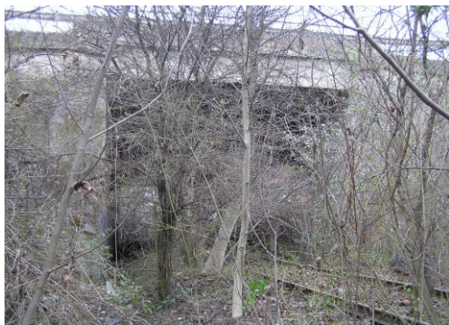
Fákkal benőtt sín az M1 mellett.