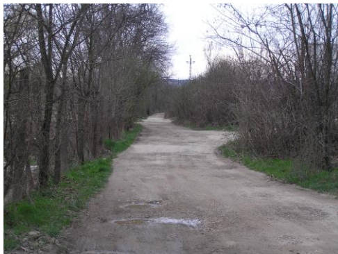
Ez a "B" variáns az Auchan felé.