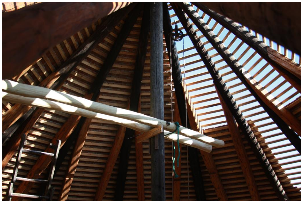
Épül a pajta, készül a tető.

tok nagyon szelídek, barátságosak. A lovakat bátran lehet simogatni, és nagyon örülnek, ha a látogatók megkínálják őket egy kis almával. Ide a tervek szerint iskolás és óvodás csoportok fognak ellátogatni, hogy megfigyelhessék a tanyasi élet szépségeit, és többet megtudjanak az állatokról. Egy fedett foglalkoztatót már állítanak az ácsok, és talán egyszer egy kis kilátó is készül majd ide, hiszen csodálatos kilátás nyílik innen a budaörsi hegyekre. A menhelynek ez a része várhatóan 2018-ban fog elkészülni. A bemutatóhely az önkormányzat anyagi támogatásával készül.