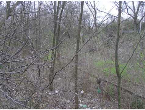
Az elhagyott pálya.