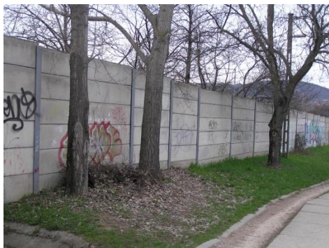
Zajvédő fal az M7 mellett.