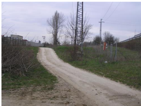
Erre nem mehet a kerékpárút.