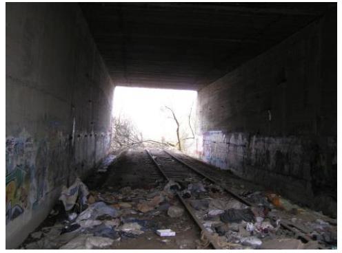
Két kamion is, nemhogy kerékpárút.